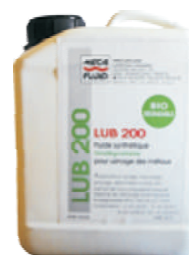
Šifra: 50.759.001 Sintetična tekočina za mazanje LUB200 Sintetičen, biorazgradljiva tekočina za strojno obdelavo kovin. Količina: 2 L