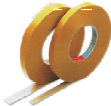
Šifra: širina 9 mm poli 57.999.009 širina 12,7mm prozoren 57.999.012 širina 14 mm 57.999.014 širina 19 mm 57.999.019 širina 19 mm poli 57.999.020 širina 48 mm 57.999.048 Dvostranski samolepilni trak.