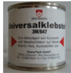
Šifra: 50.758.000 Univerzalno lepilo 3M