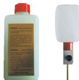
Šifra: 50.757.000, Vargol Specialna mazalna tekočina za VARGA žage. Sintetično olje za uporabo pri rezanju vseh materialov. Količina: 500 ml