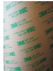
Šifra: 57.999.000 3M folija Kaširanje s samolepilno 3M folijo.