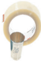
Šifra: 19528 Zaščitni trak za zaščito nakita in medeninastih ploščic za na vrata, med graviranjem. Velikost: 100 m x 50 mm