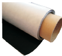
Šifra: 51.100.000 Magnetna folija Nalepi se na hrbtno stran materiala.