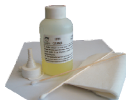
Šifra: 50.756.327 Set za čiščenje leč na laserju. Šifra: 50.756.328 Palčke za čiščenje leč.