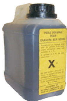
Šifra: 50.761.000 Soluble oil Tekočina za mazanje stekla za steklo. Količina: 1 L.