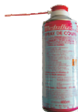
Šifra: 50.766.400 Gravoflux Rezalno olje za kovine v spreju, 400 ml.