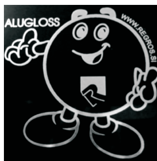
Primer gravure na Alugloss.